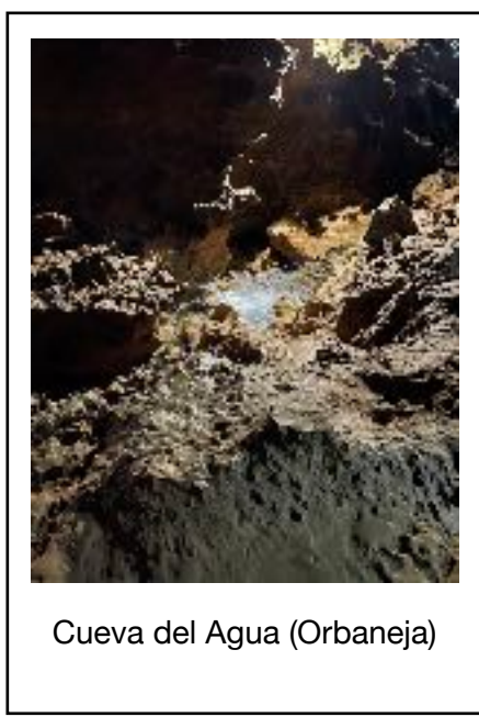
Cueva del Agua (Orbaneja)