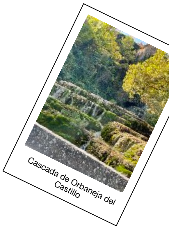
Cascada de Orbaneja del Castillo